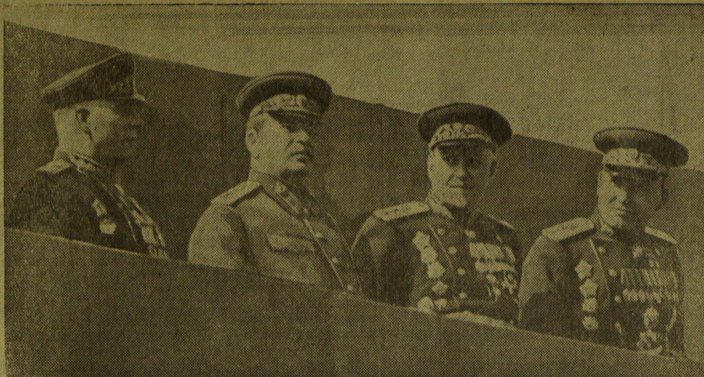
ПРАЗДНОВАНИЕ 1 МАЯ 1948 г. в МОСКВЕ. На снимке: К. Е. Ворошилов, И. В. Сталин, Н. А. Булганин и И. С. Конеv на трибуне мавзолея Ленина.