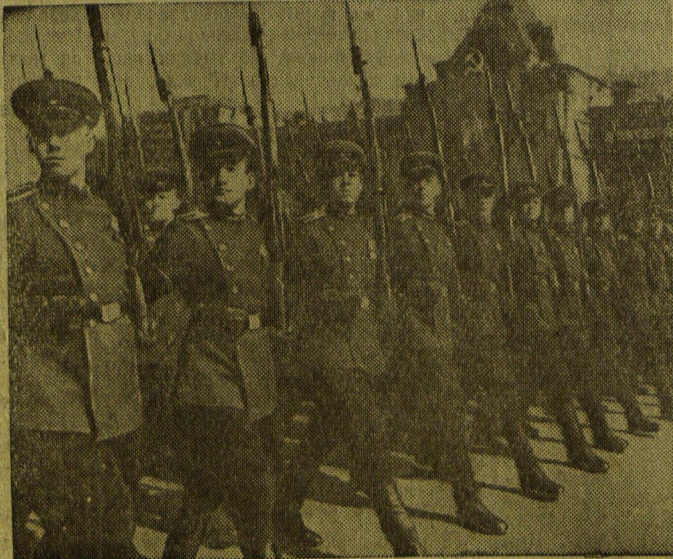
ПРАЗДНОВАНИЕ 1 МАЯ 1948 г. в МОСКВЕ. Парад войск московского гарнизона на Красной площади. На снимке справа: курсанты военных школ на параде. На снимке слева: танки на параде.